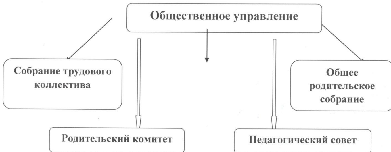
Схема общественного управления

Управление учреждением осуществляется в соответствии с Федеральным законом «Об образовании в Российской Федерации», на основании Устава с соблюдением принципов единоначалия и самоуправления.